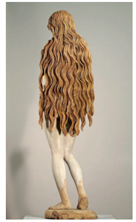
Sainte Marie Madeleine, vers 1515 - 1520, Augsbourg Visible au Louvre

Texte de l'évangile du jour: Jean 20, 1-9